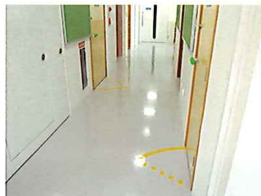
◎0・1クラスは床暖房