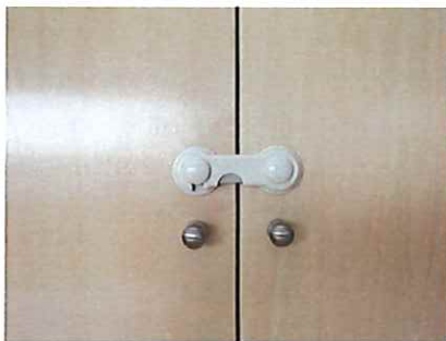
◎地震時の落下防止ストッパー