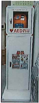
◎自動体外式除細動器（AED）