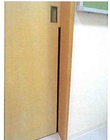
◎引き戸の安全ゴムの設置