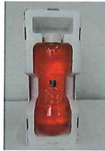
◎投てき用簡易消化用具