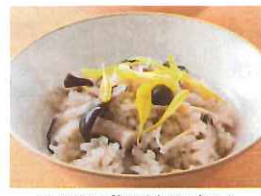
きのこの炊き込みごはん