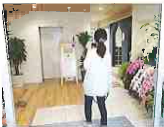
④親子で一緒にお入りください。 *帰りは保護者が 自動 ボタンを 押して開けて下さい。