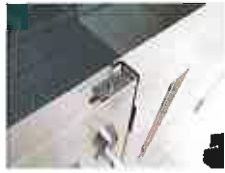
毎回安全ロックを かけて下さい。