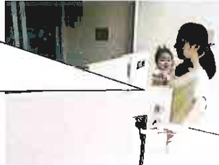
②門扉の取手を下げて手前に 引いてください。