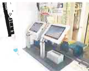
⑤玄関カウンターにあるタッチ パネルでお迎え者とお迎え時間 を入力して下さい。