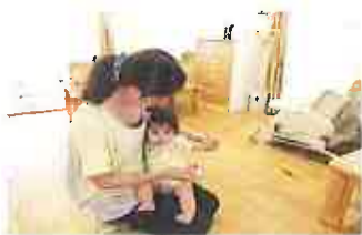
⑦体温を測り、保育士に体温計を手渡します。