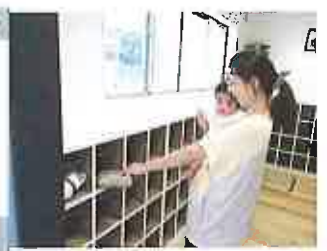
⑥玄関に入ってくつを脱ぎ 靴箱に入れてください。

※いつもと変わる場合は、カウ ンターに置いてある用紙に記入 し職員にもひと声かけお渡し下 さい。