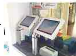
(登降園管理システム(タッチパネル))