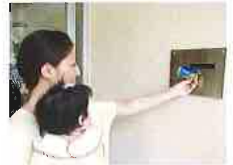
③カードを『登降園管理システム』 にタッチし、自動ドアを開けてお 入りください。