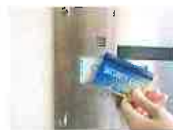
(セキュリティカード 自動ドア開閉)