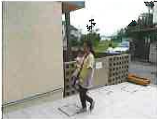
①正面の入り口から登園します。

お子さんは、毎日の繰り返しの中で生活習慣を身につけていきます。登園されたら一緒に次の手順をお願いします。