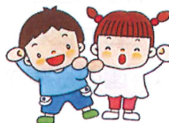
やる気いっぱい元気な子