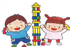
力を合わせて頑張る子