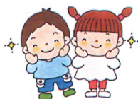
ほほえみ輝くやさしい子